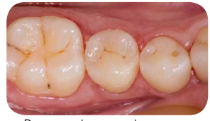
Вигляд після полірування