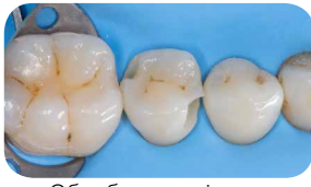
Обробка некаріозних порожнин