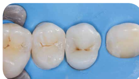
Реставація з everX Posterior (замінника дентину) та Essentia Універсального для зовнішнього ламінування