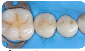
Реставація за допомогою Essentia LoFlo Універсальний