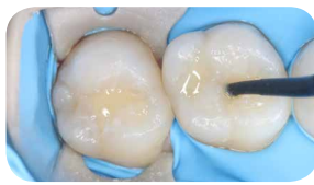
Реставрація за допомогою Essentia HiFlo Універсальний