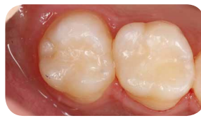
Фінальний вигляд, що демонструє гарну інтеграцію до натуральних тканин зуба