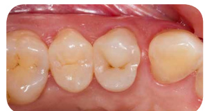
Повторний огляд через 6 місяців демонструє гарну інтеграцію із сусідніми тканинами зубів