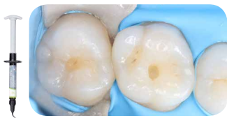
Препарування малої порожнини I класу