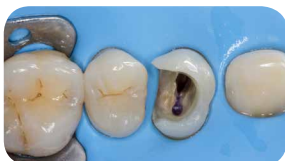
Було обрано прямий підхід для цього складного випадку із депульпуванням зубів